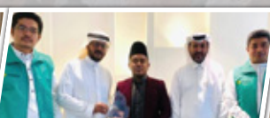
MOU Syarikat Dallah Transport