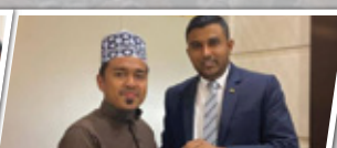
Sesi MOU Bersama Ghufuran Hotel Safwah tower