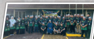
Kursus Pemantapan Mutawwif