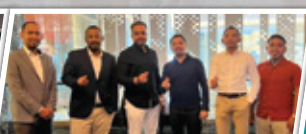
Bersama Accor Group Clock Tower Makkah