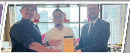
Anugerah Best Partnership By Ghufuran Hotel (Safwah Tower)